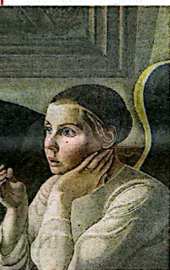
Qui sopra, a sinistra: John Maynard Keynes e la moglie, la ballerina Lydia Lopokova (1891-1981), in un ritratto di William Roberts (olio su tela, 1932, National Portrait Gallery, Londra); in alto: Keynes e la moglie in un momento di danza; qui sopra, a destra: Virginia Woolf (1882-1941) e Keynes, tra gli intellettuali del gruppo di Bloomsbury